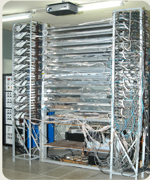
மும்பையில் உள்ள மாதிரி டிடெக்டர்

மேலும் விவரங்களுக்கு: http://www.hecr.tifr.res.in/~ino/